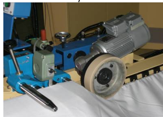
②ピンニング及びオーバーフィード装置